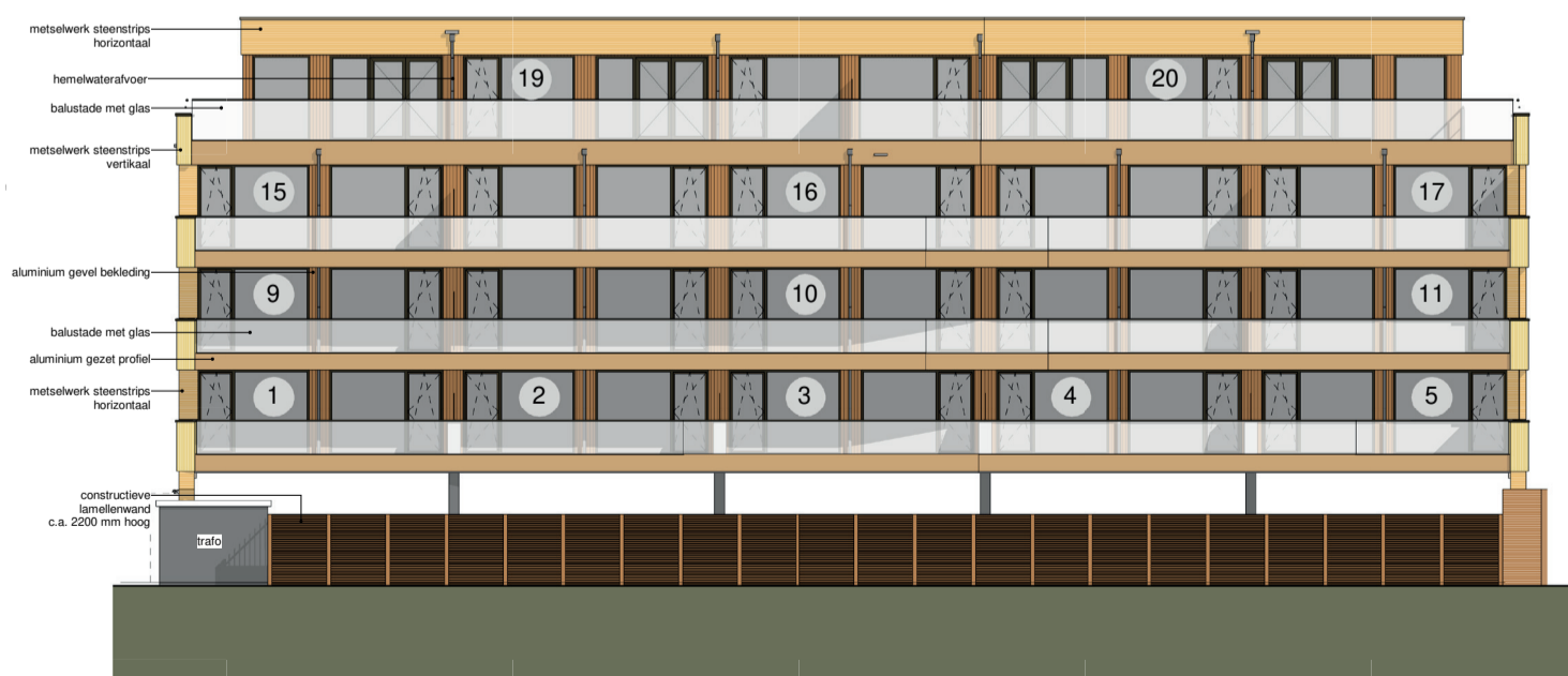
Achtergevel (grenzend aan de Voorhof)