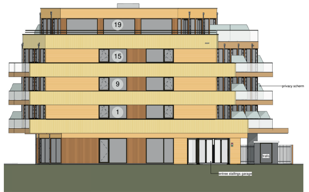
Rechterzijgevel (Dijkweg) geluidsbelaste gevel